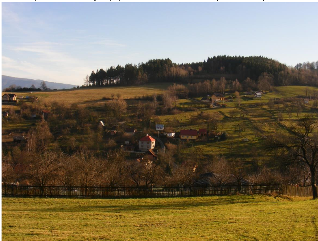
Sojov na Štědrý den 2014.

27,2 st. C. Veselští lyžaři doufali, že po mizerné loňské sezóně se konečně rozjedou vleky na horním konci Veselé, první odvážlivci začali sjíždět svahy nad Veselou na Silvestra po celonočním zasněžování.