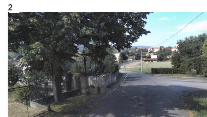
1, 2 – pohled na kříž a lipu – dle www.mapy.cz 3 – kříž s lipou