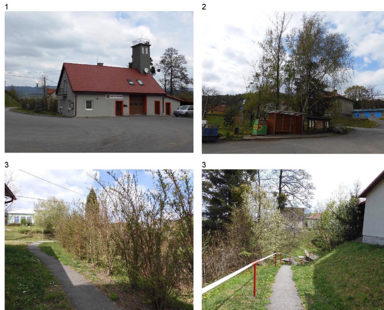
1 – hasičská zbrojnice a menší travnatá plocha s dřevinami západně od budovy