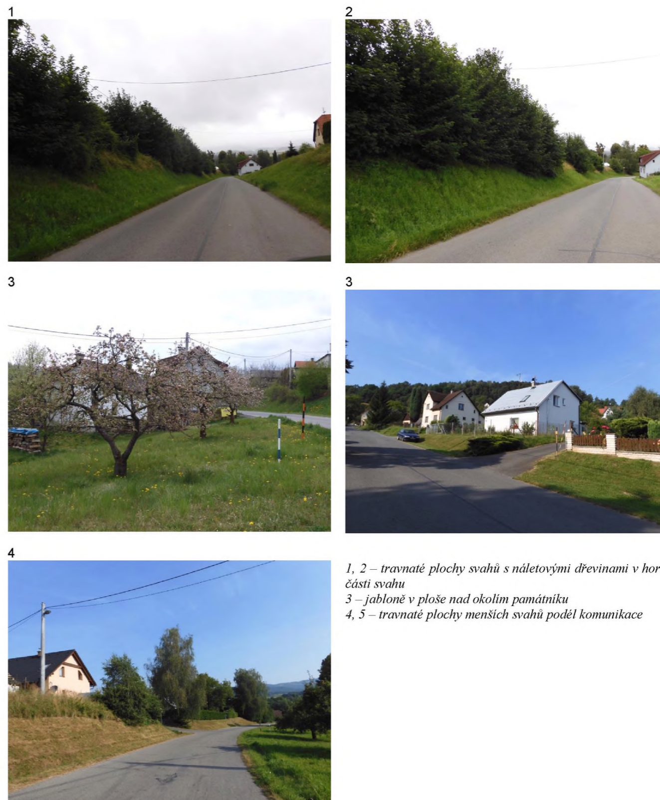
1, 2 – travnaté plochy svahů s náletovými dřevinami v horní části svahu 3 – jabloně v ploše nad okolím památníku 4, 5 – travnaté plochy menších svahů podél komunikace