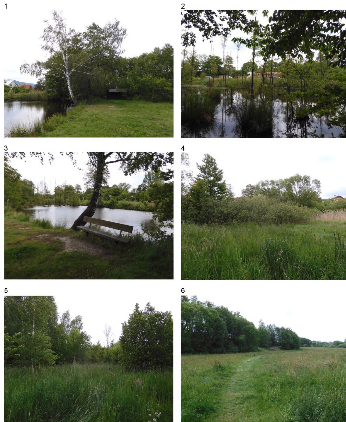
1 a 3 – okraj vodní plochy s lavičkou a dřevěnou stavbou 2 – odumírající a odumřelé dřeviny zaplavené vodou 4 -plochy se skupinami keřových vrb