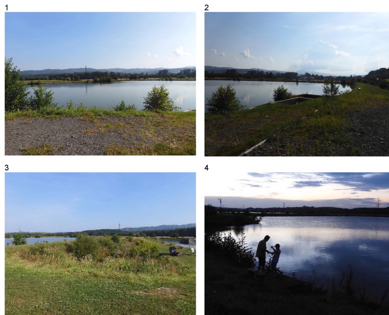
1, 2 – vodní plochy rybníků a mladá narůstající vegetace břehů