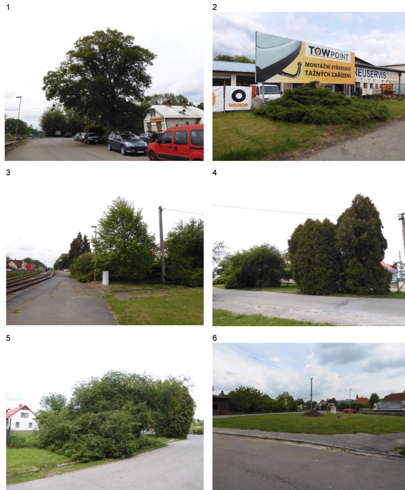
1 – solitérní javor