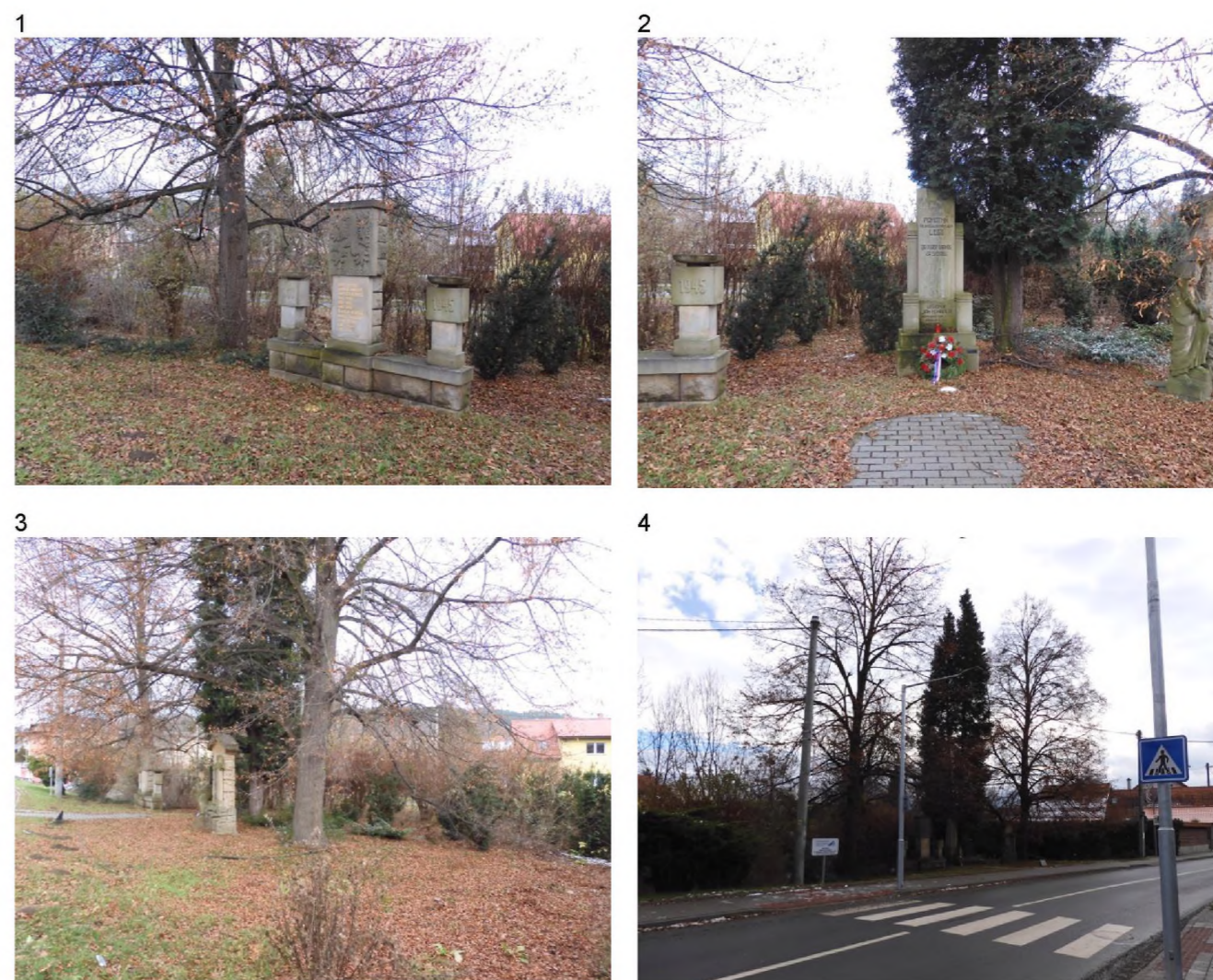
1 – 4 – plochy kolem tří památníků. Vzrostlé lípy, zerav a mezernatý podrost keřových výsadeb.