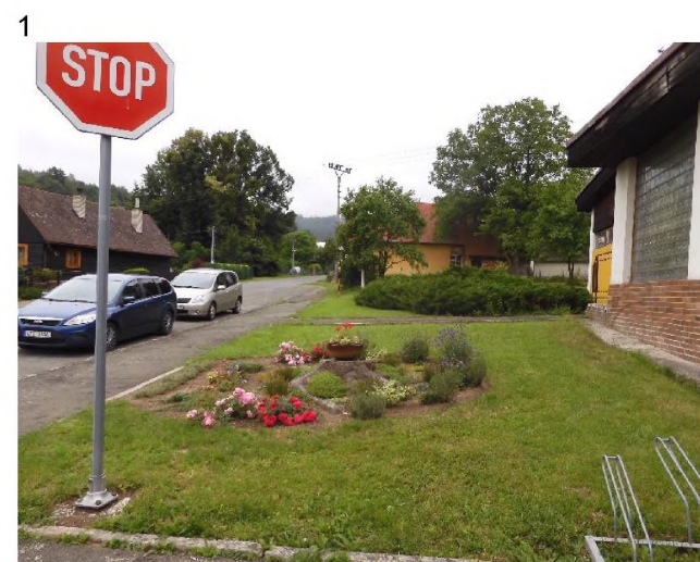
1 – volná travnatá plocha se záhonem a keřovou skupinou