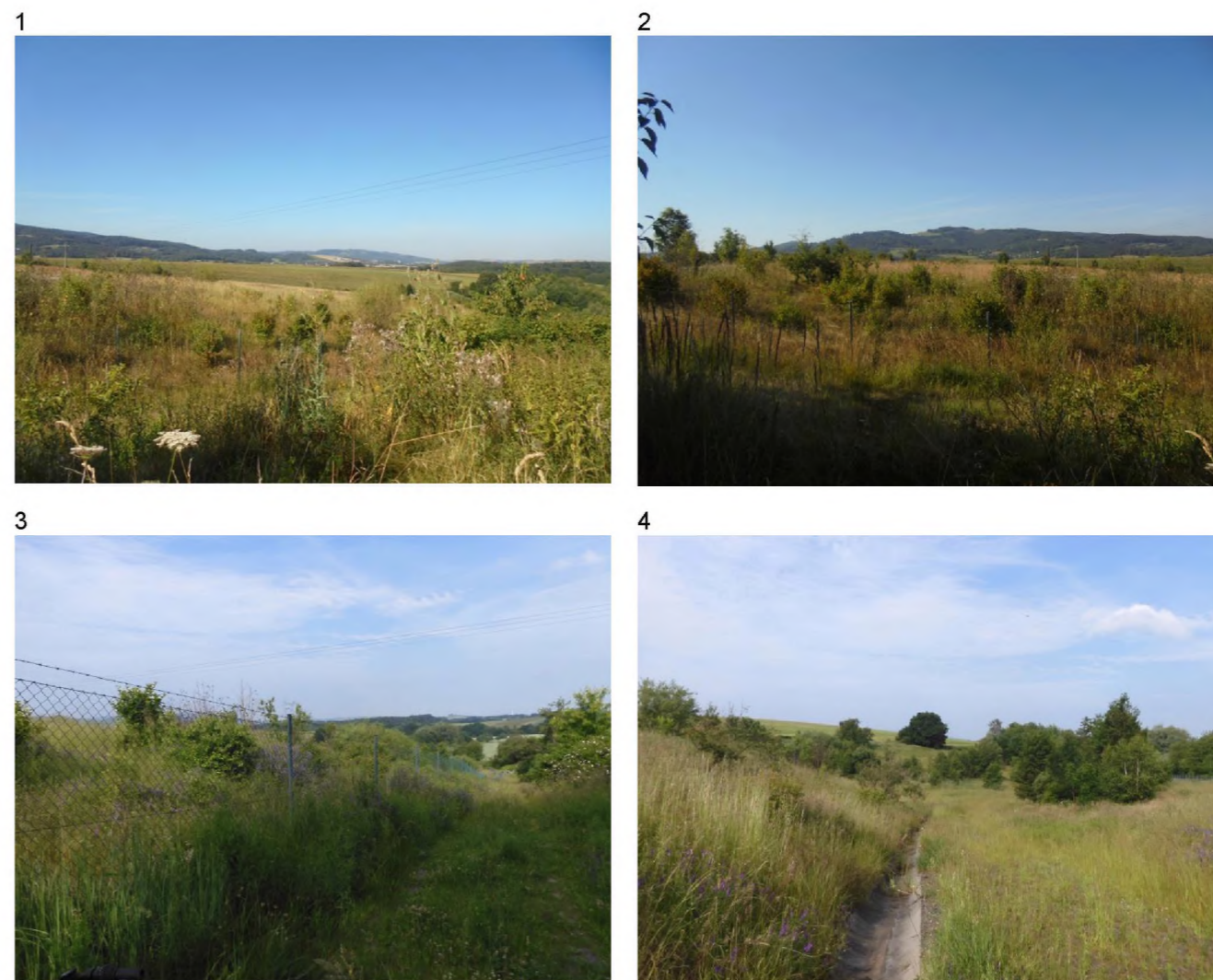
1, 2, 4 – volná travnatá plocha s keři z náletů. V západní části skupiny stromů. 3 – u severní hranice této lokality vede historická polní cesta