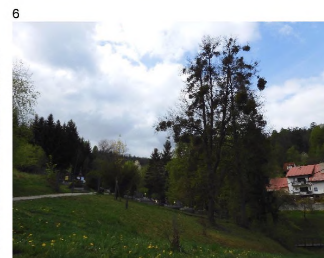
1 – pohled na kostel sv. Martina od severu 2 – akátové stromořadí podél přístupového chodníku 3 – hřbitov kolem kostela a výhledy do krajiny