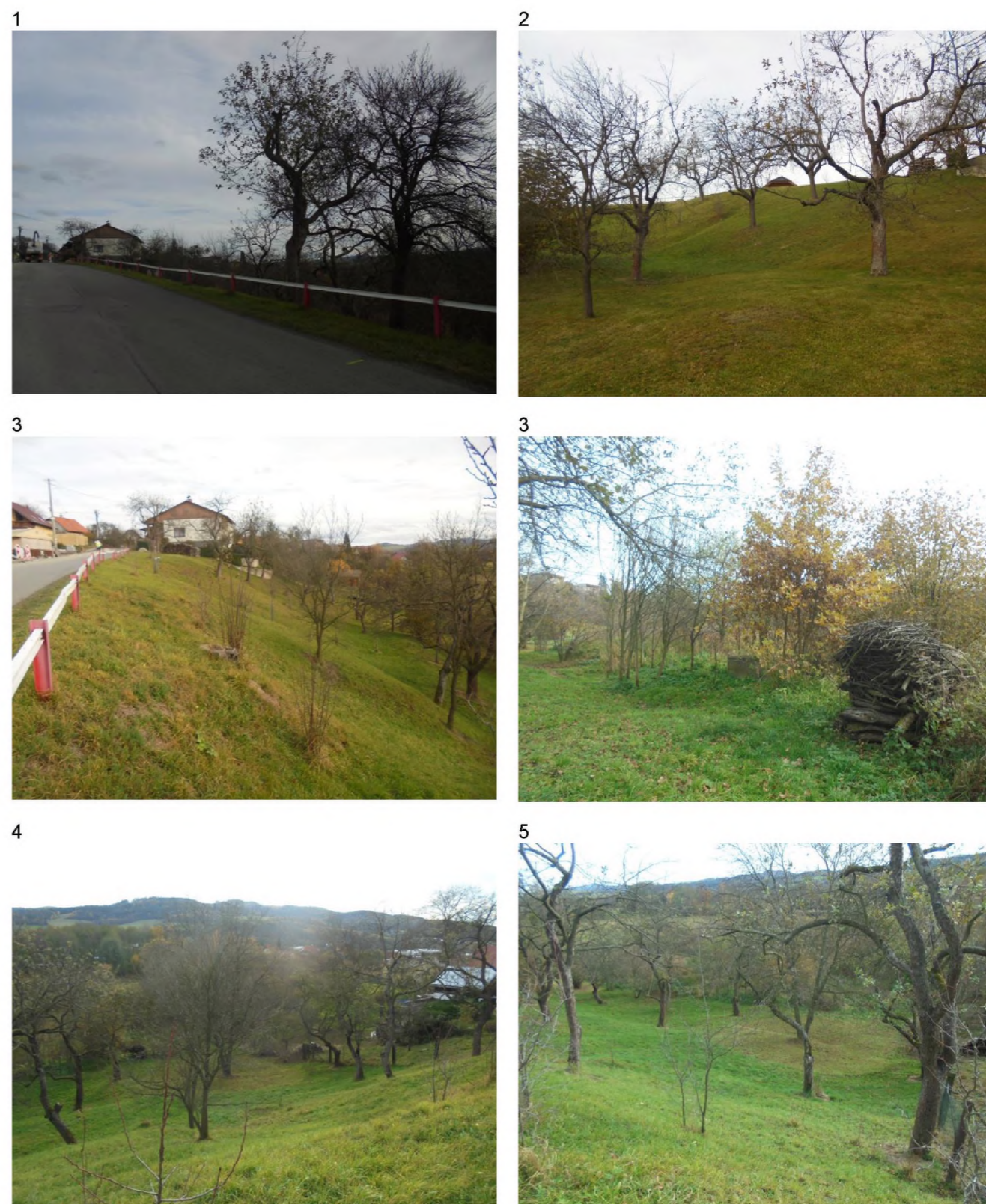
1-2, 4-5 – plocha extenzivního sadu 3 – hromada větví – úkryty pro ježky,...