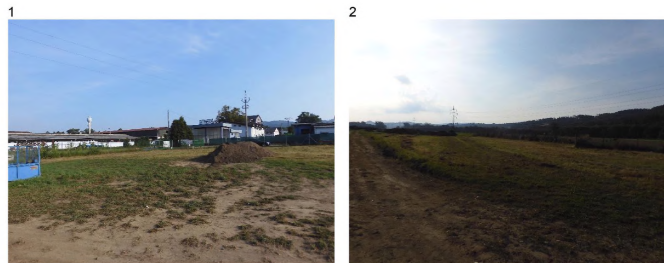
1 a 2 - volná travnatá plocha