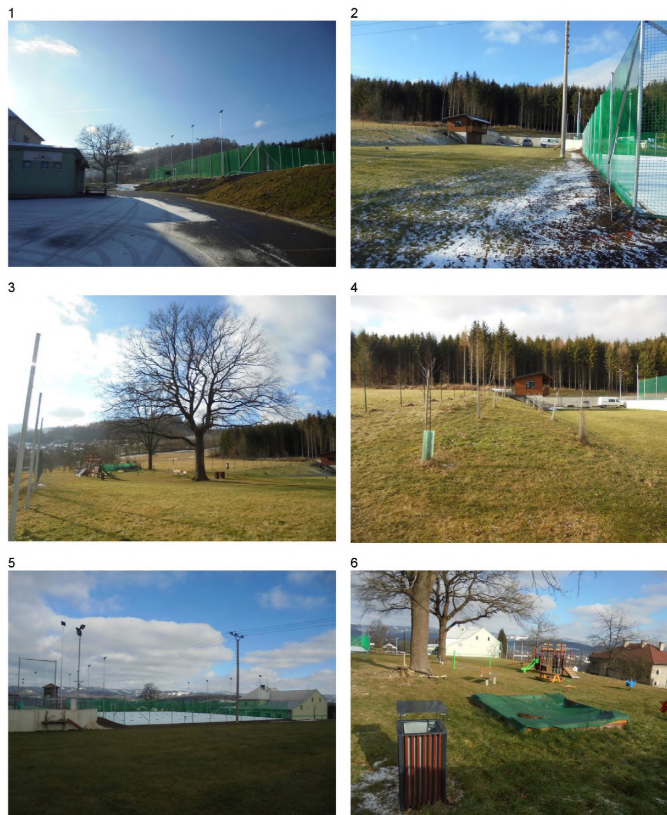
1 – parkoviště u kulturního domu, oplocené tenisové kurty, travnaté svahy 2 – hasičské cvičiště 3 – památná dřevina – dub a dětské hřiště východně od dubu