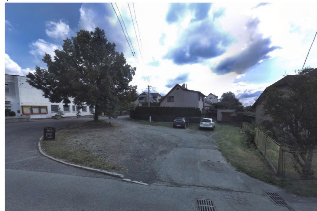
1 – plocha dle www.mapy.cz