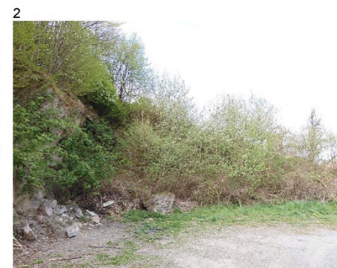
1, 2 – skalnaté výchozy zarůstající spontánně vegetací