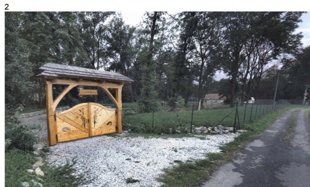
1, 2 – stav lokality dle www.mapy.cz