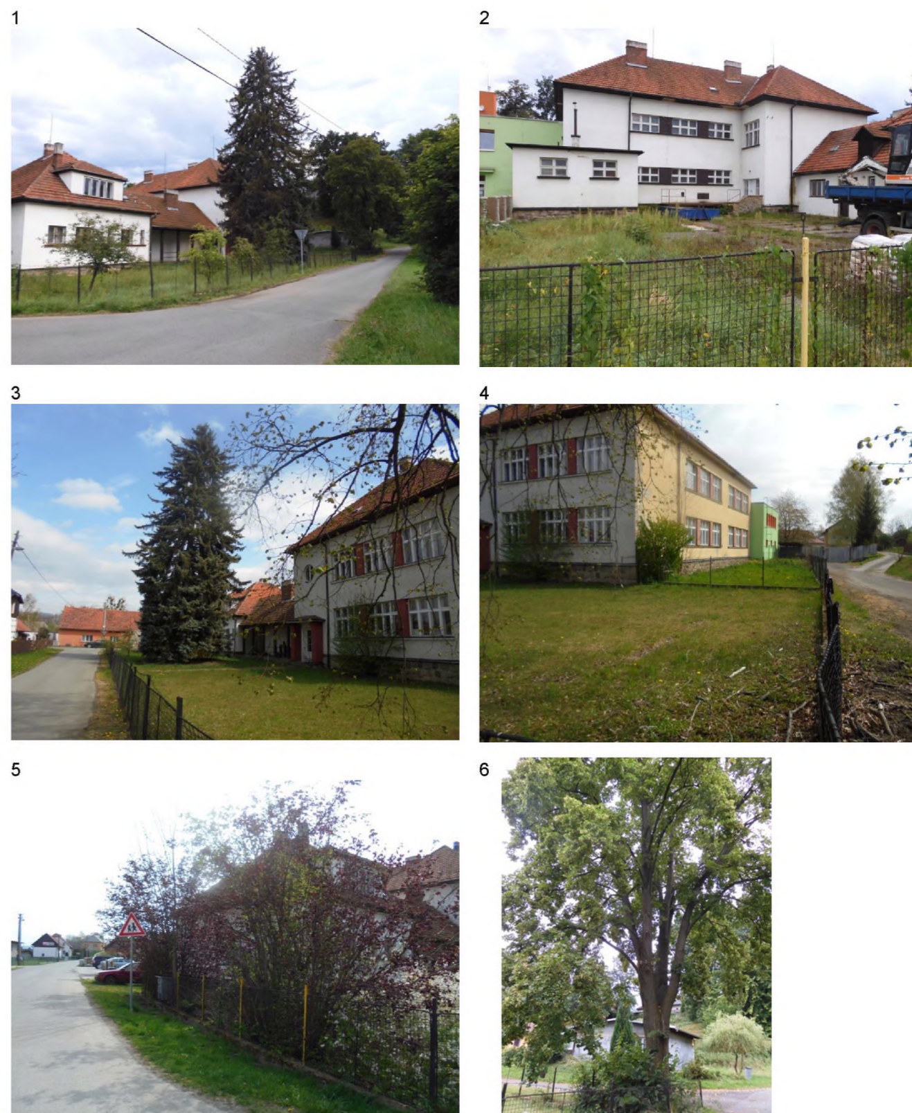
1 – mladé ovocné dřeviny a solitérní smrk 2 – nádvoří s většinou zpevněné plochy, za oplocením 3 – solitérní smrk a travnatá plocha