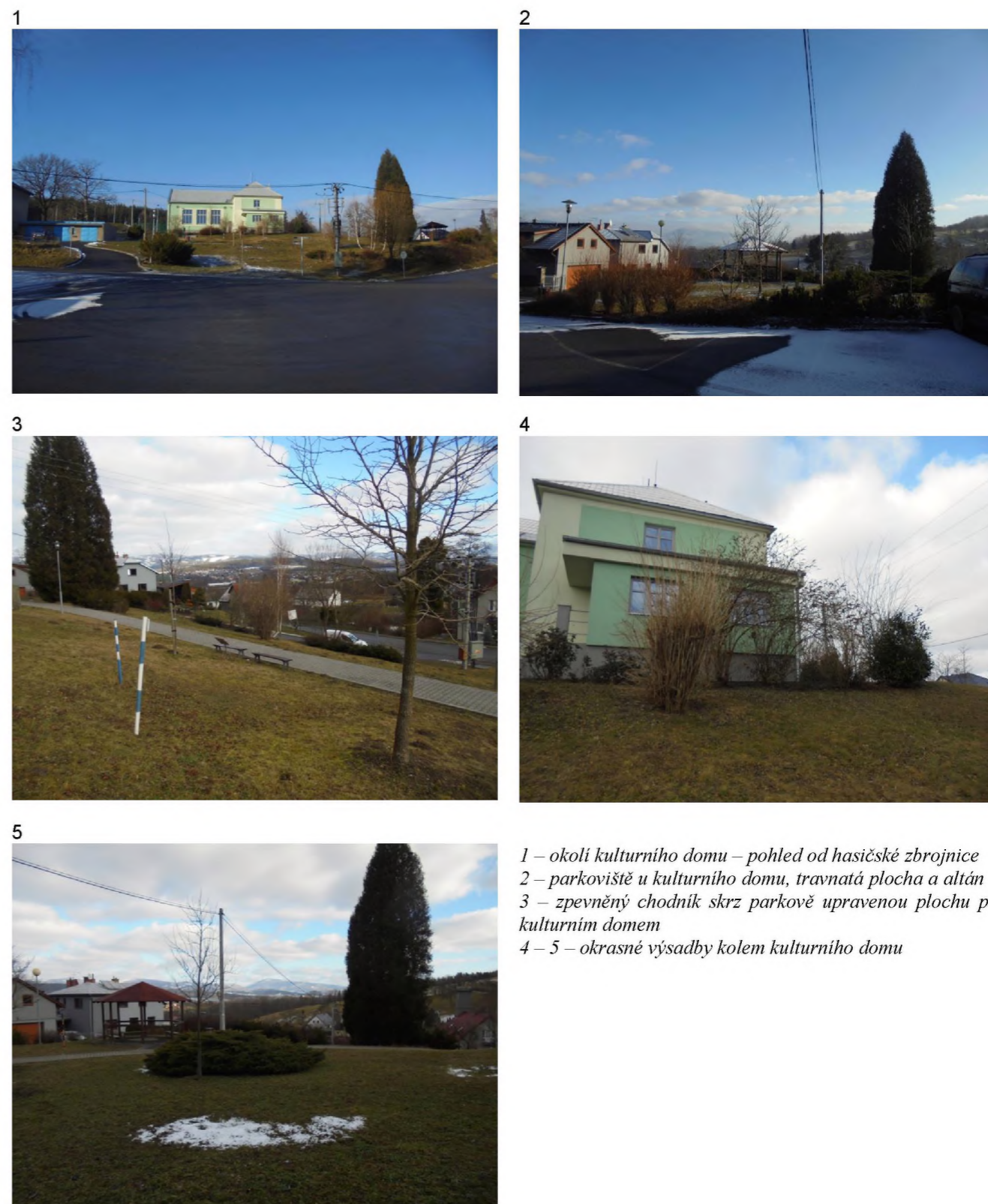
1 – okolí kulturního domu – pohled od hasičské zbrojnice 2 – parkoviště u kulturního domu, travnatá plocha a altán 3 – zpevněný chodník skrz parkově upravenou plochu pod kulturním domem 4 – 5 – okrasné výsadby kolem kulturního domu