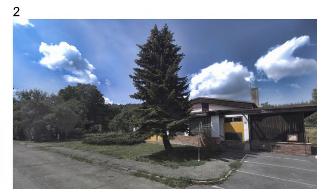
2 – původní stav s dřevinou