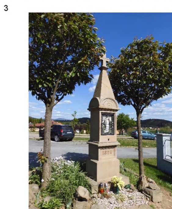
1, 3 – pohled na kříž 2 – záhon u kříže a lavička