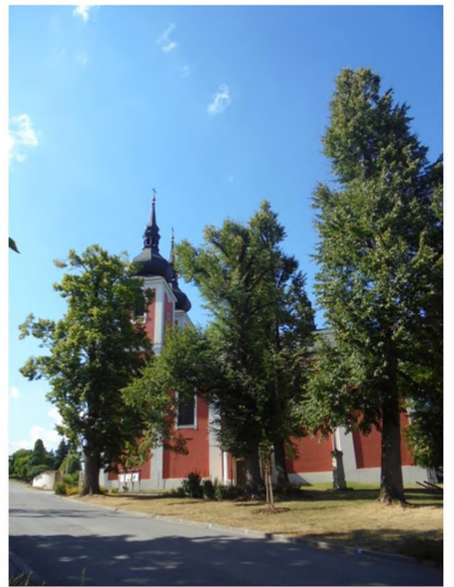
6 , 7, 8, 9 – spodní část plochy s keřovými výsadbami 8 – chodník vedoucí k parkovišti 10 – kamenný kříž na křižovatce 11 – lípy u kostela