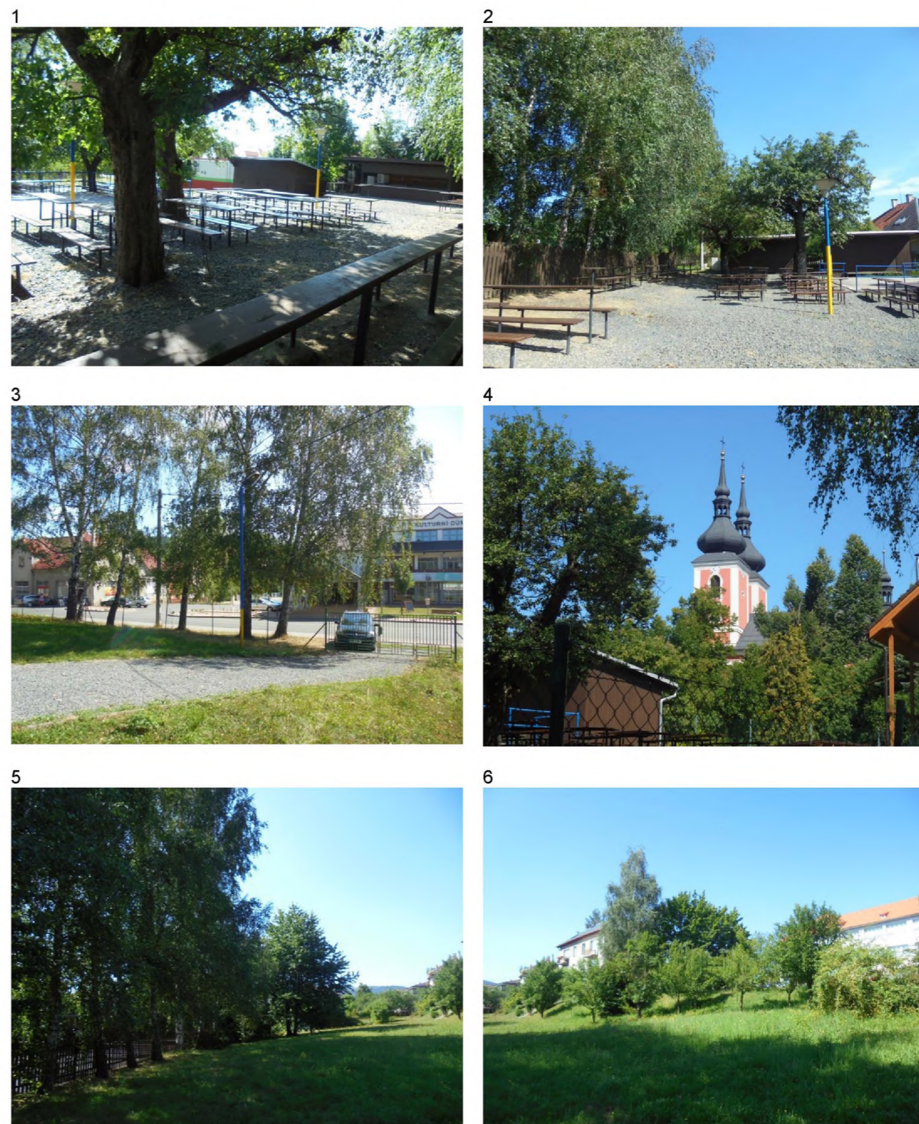
1, 2 – lavičky v prostoru výletišťe (před kácením jabloní) 3 – břízy u vstupu na výletišťe 4 – na několik místech se nachází průhledy na budovu kostela