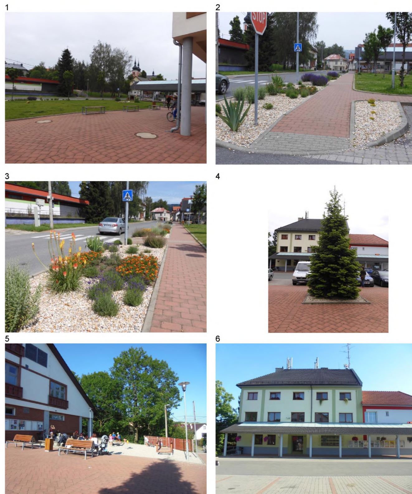
1 – pohled přes náves na kostel a vyletiště 2, 3 – kolem chodníku jsou vysazeny trvalková výsadby mulčované štěrkem s částmi pro letničky, okraj travnaté plochy lemují krátké stromořadí okrasných třešní 4 – jižně od kulturního domu je vysazen jehličnatý strom