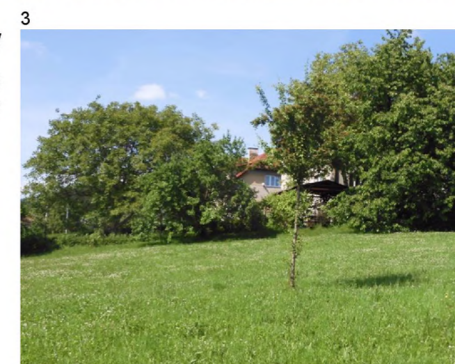
3 – u severní hranice této lokality se nachází ovocné dřeviny. Na SV okraji této plochy se nachází pozemek obce zaplácený soukromníkem k zahradě.