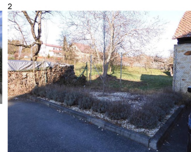
1 – stav dle www.mapy.cz (rok 2017) – dnes již bez borovice 2 – záhon v rohu parkoviště 3 – výsadba za budovou 4 – původní místo borovice, dnes jen štěrková plocha s pařezem