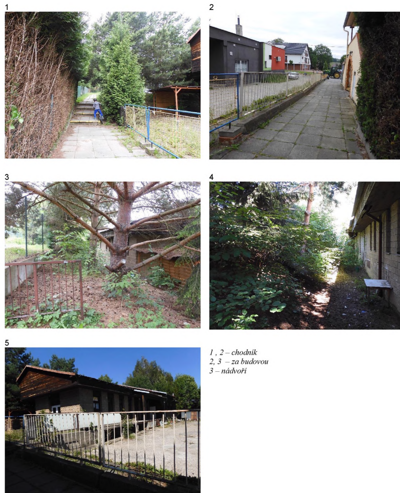
1, 2 – chodník 2, 3 – za budovou 3 – nádvoří