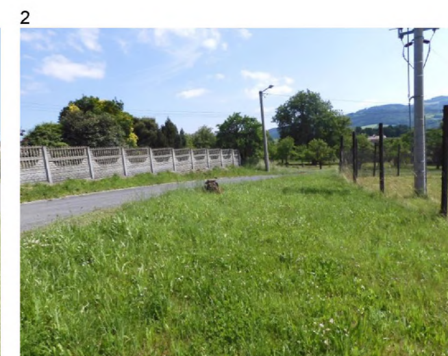
1, 2 – volná travnatá plocha se soliterní dřevinou nad hřištěm