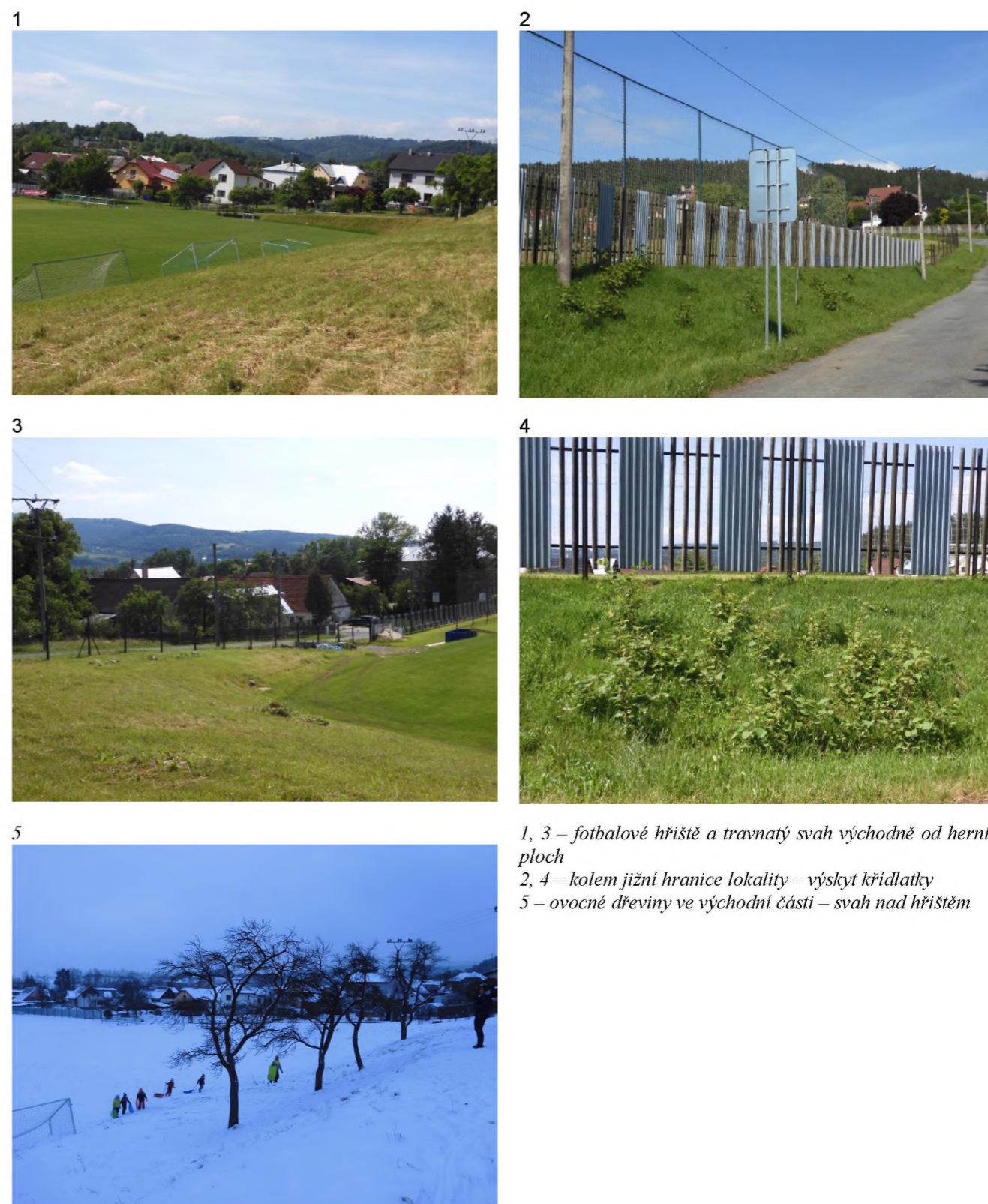
1, 3 – fotbalové hřiště a travnatý svah východně od herních ploch 2, 4 – kolem jižní hranice lokality – výskyt křídlatky 5 – ovocné dřeviny ve východní části – svah nad hřištěm