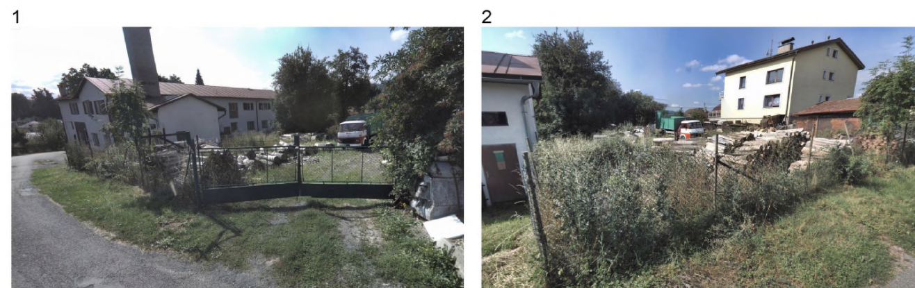
1, 2 – pohled od severu - stav dle www.mapy.cz 3 – pohled od východu – stav dle www.mapy.cz 4 -před vstupem 5 – zadní část a dvorek