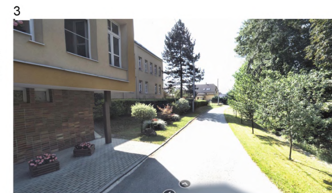
3 – u severní hranice této lokality se nachází ovocné dřeviny. Na SV okraji této plochy se nachází pozemek obce zaplacený soukromníkem k zahradě.