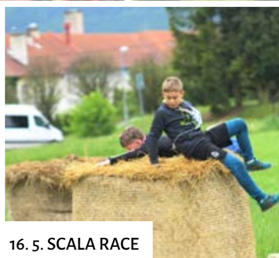
16. 5. SCALA RACE