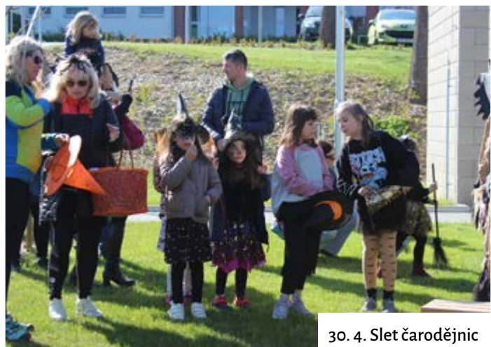
30. 4. Slet čarodějnic