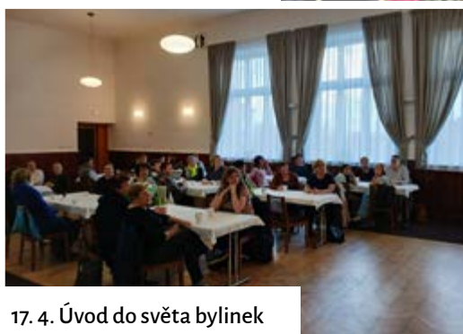
17. 4. Úvod do světa bylinek