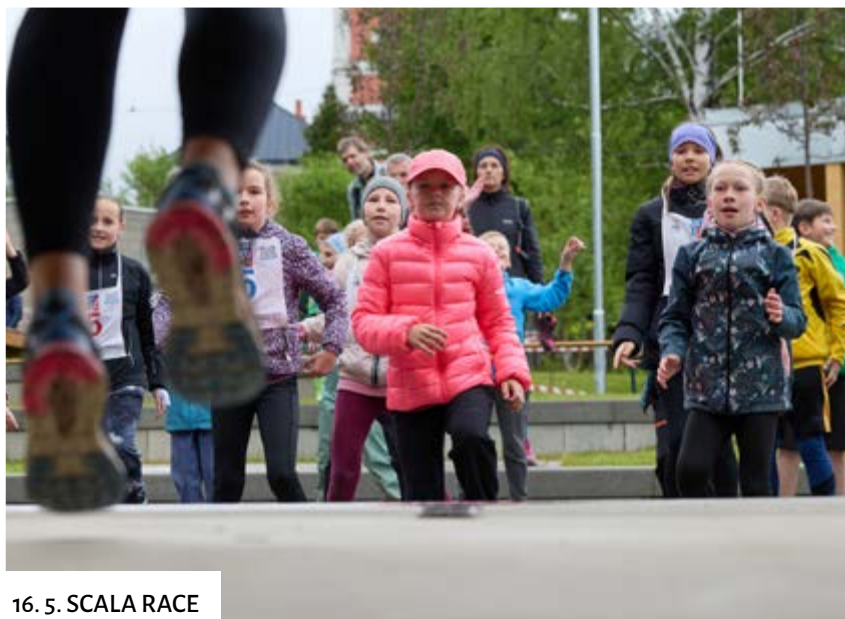
16. 5. SCALA RACE