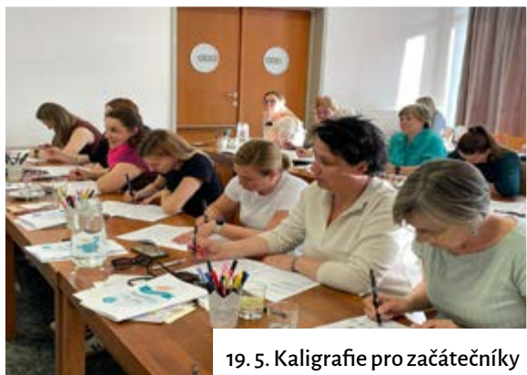
19. 5. Kaligrafie pro začátečníky