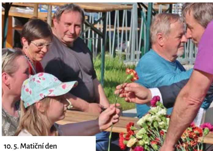
10. 5. Matiční den