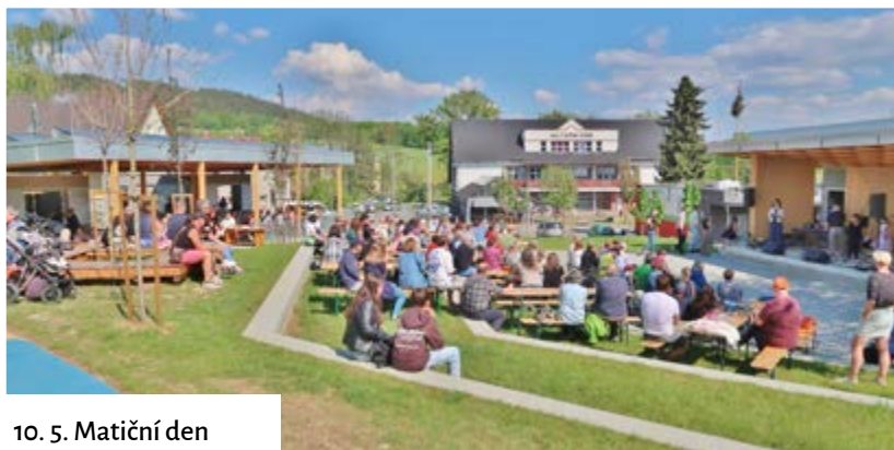
10. 5. Matiční den