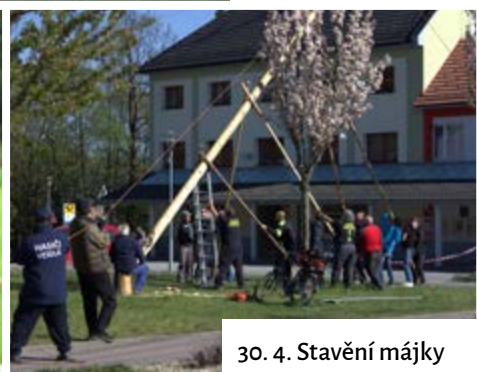
30. 4. Stavění májky