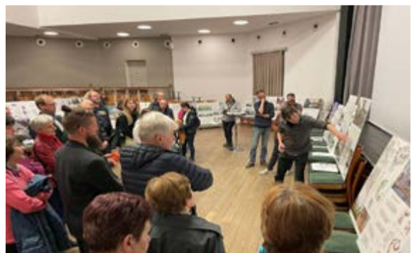
15. 4. Kulatý stůl s občany a výstava architekt. návrhů