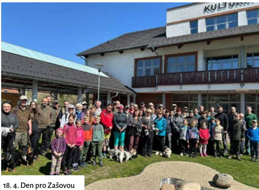
18. 4. Den pro Zašovou