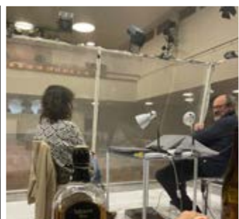
29. 3. Dobrý proti severáku

Fotografie a text v obci najdete na www.zasove-vesela.rajce.idnes.cz