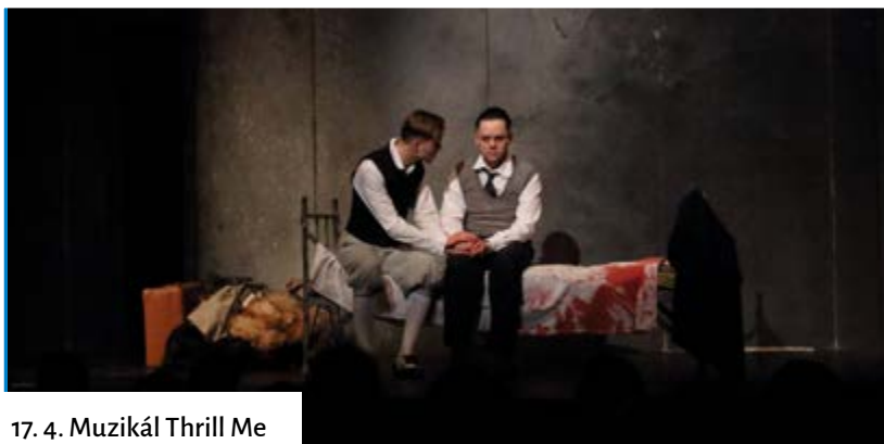
17. 4. Muzikál Thrill Me