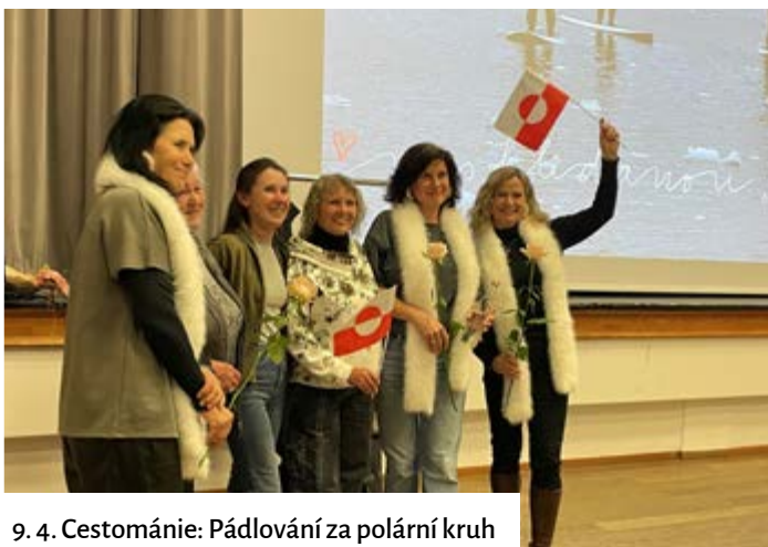
9. 4. Cestománie: Pádlování za polární kruh