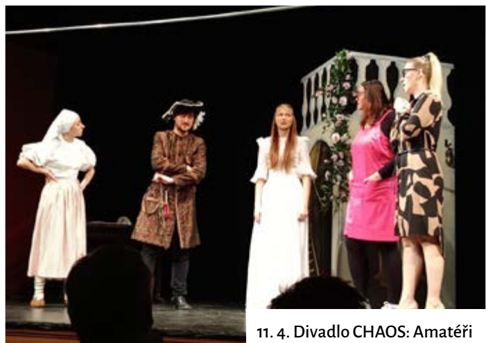
11. 4. Divadlo CHAOS: Amatéri