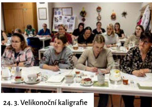
24. 3. Velikonoční kaligrafie