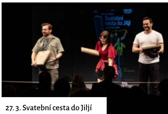
27. 3. Svatební cesta do Jiljí