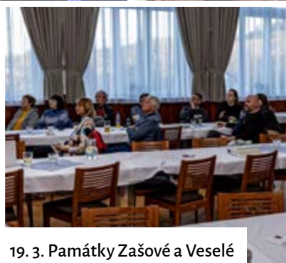
19. 3. Památky Zašové a Veselé