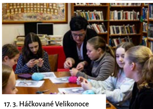
17. 3. Háčované Velikonoce