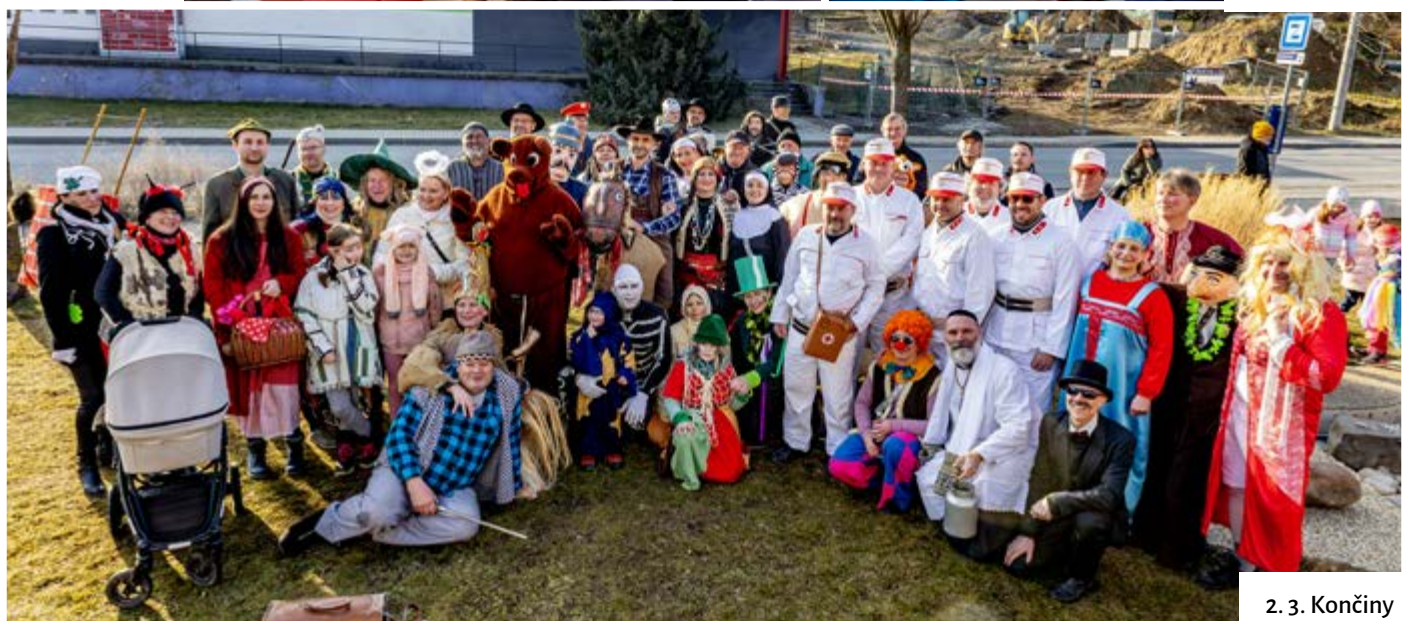
2. 3. Končiny