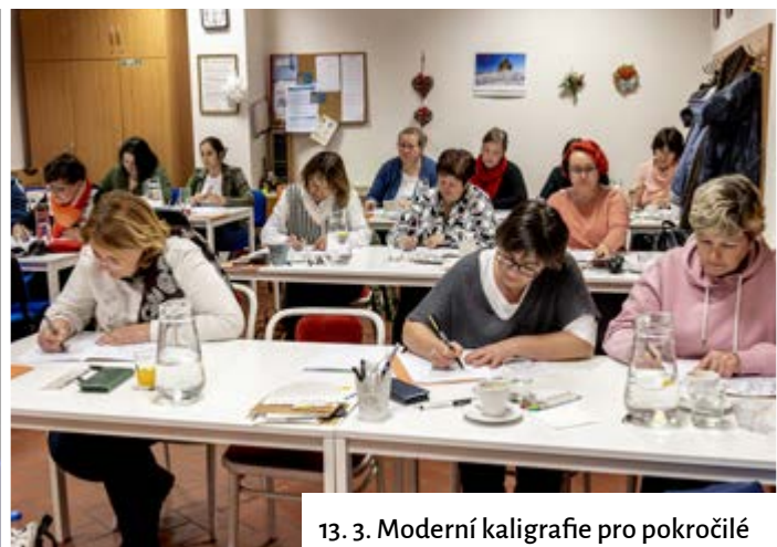
13. 3. Moderní kaligrafie pro pokročilé