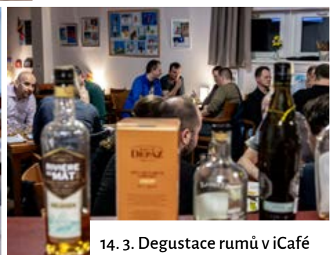
14. 3. Degustace rumů v iCafé