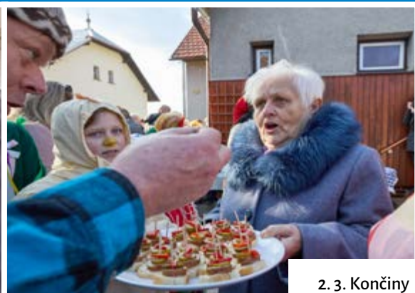
2. 3. Končiny