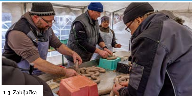
1. 3. Zabijačka