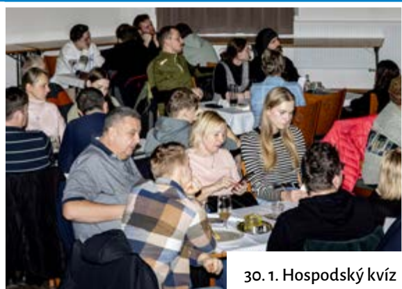
30. 1. Hospodský kvíz