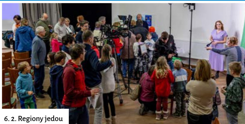
6. 2. Regiony jedou