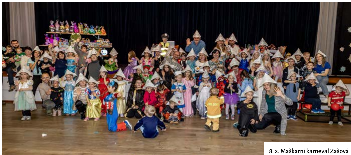
8. 2. Maškarní karneval Zašová