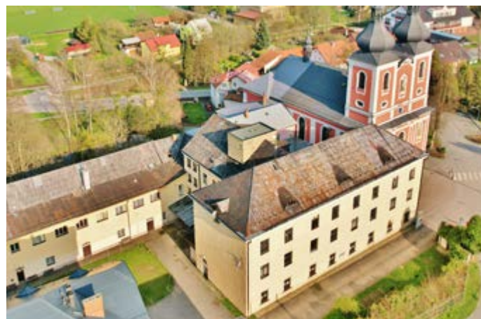
Učebny ZUŠ by se nacházely převážně za okny 1. patra hlavní budovy.