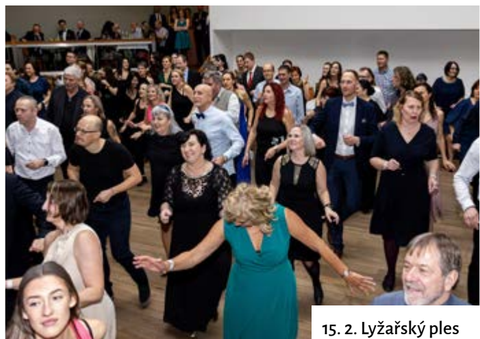
15. 2. Lyžařský ples