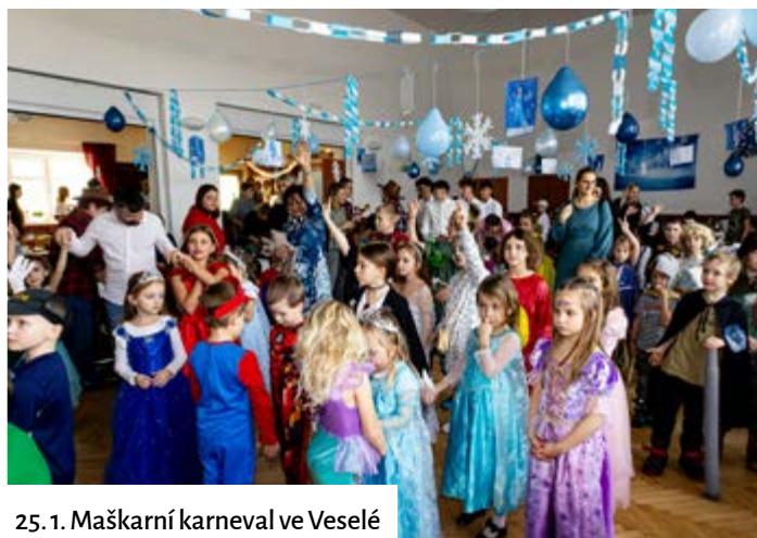
25. 1. Maškarní karneval ve Veselé