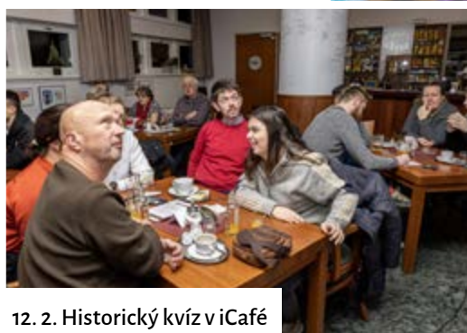
12. 2. Historický kvíz v iCafé