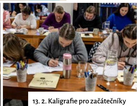
13. 2. Kaligrafie pro začátečníky

Fotografie a křídlo najdete na www.zasova-vesela.najde.lidnes.cz