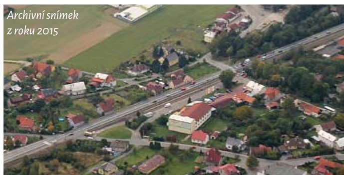
Archivní snímek z roku 2015