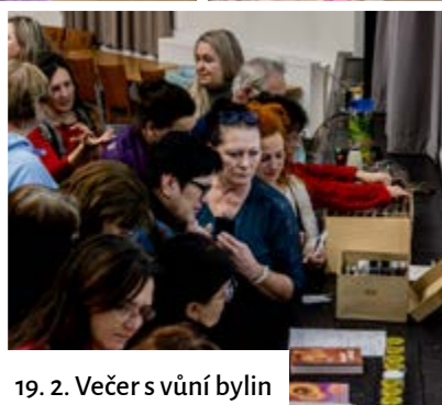
19. 2. Večer s vůní bylin