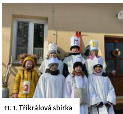
11. 1. Tříkrálová sbírka