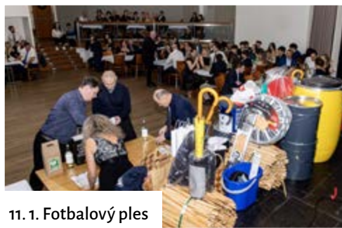
11. 1. Fotbalový ples