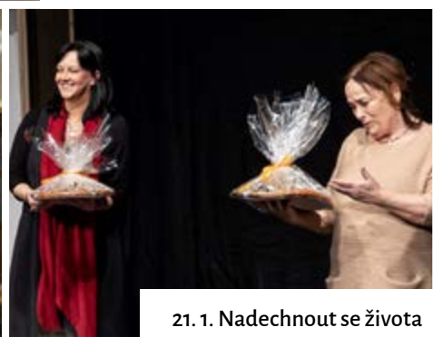
21. 1. Nadechnout se života

Fotografie z akcí v obci najdete na www.zasova-vesela.najce.idnes.cz