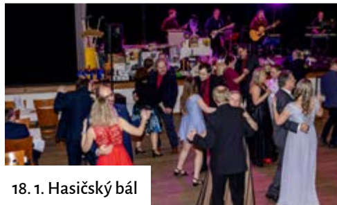
18. 1. Hasičský bál