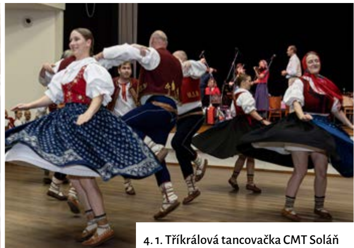
4. 1. Tříkrálová tancovačka CMT Soláň