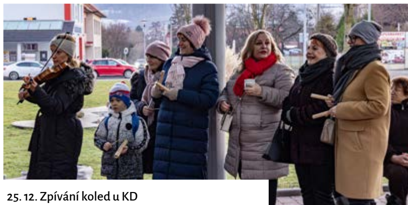
25. 12. Zpívání koled u KD