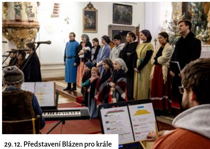
29. 12. Představení Blázen pro krále