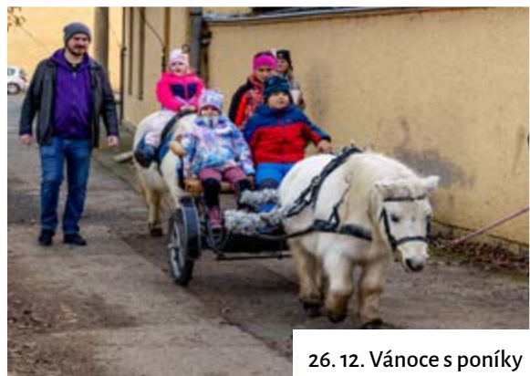
26. 12. Vánoce s poníky