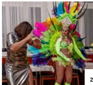
28. 12. Silvestr o den dříve