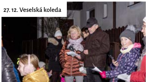
27. 12. Veselská koleda