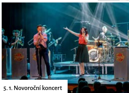
5. 1. Novoroční koncert