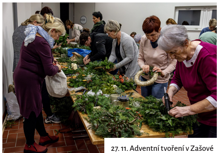
27. 11. Adventní tvoření v Zašové