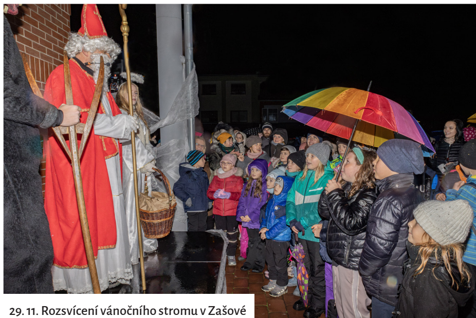
29. 11. Rozsvícení vánočního stromu v Zašové