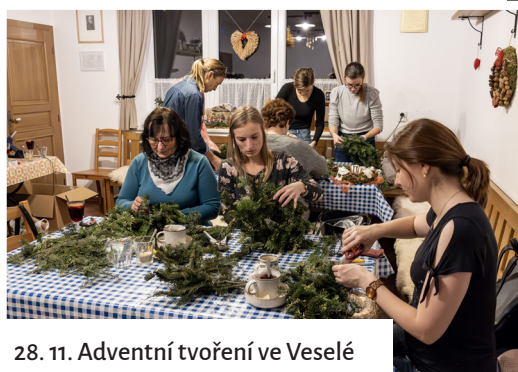
28. 11. Adventní tvoření ve Veselé