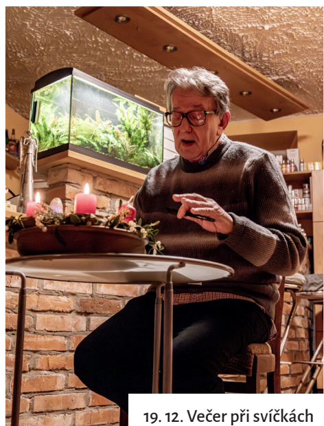
19. 12. Večer při svíčkách