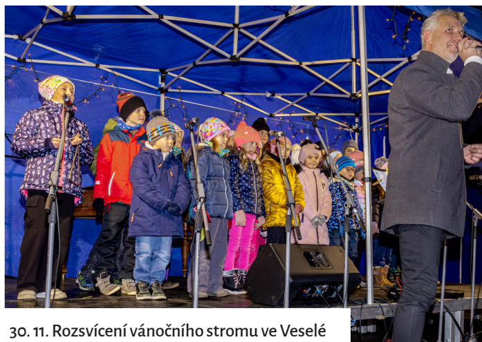
30. 11. Rozsvícení vánočního stromu ve Veselé