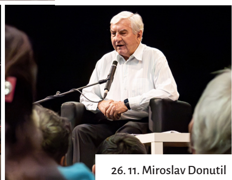
26. 11. Miroslav Donutil