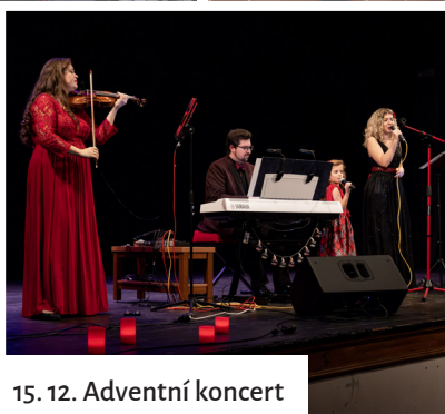
15. 12. Adventní koncert