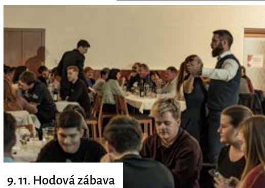
9. 11. Hodová zábava