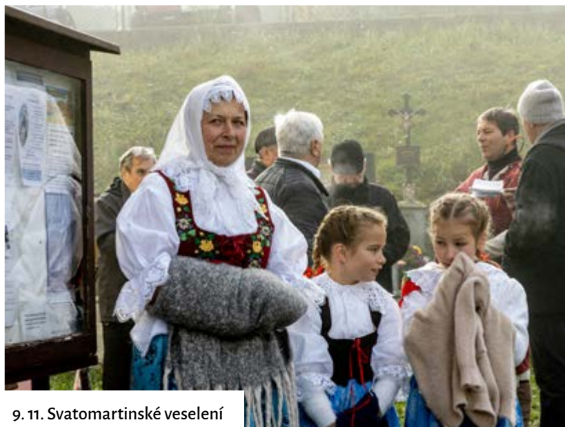
9. 11. Svatomartinské veselí