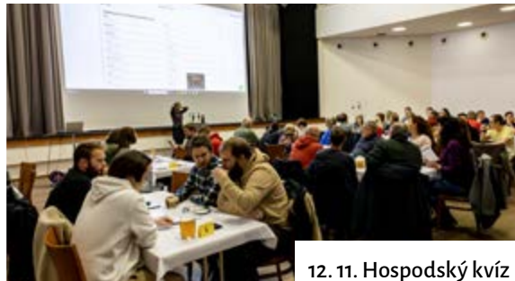
12. 11. Hospodský kvíz