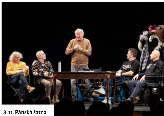
8. 11. Pánská šatna