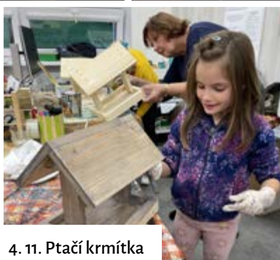
4. 11. Ptačí krmítka