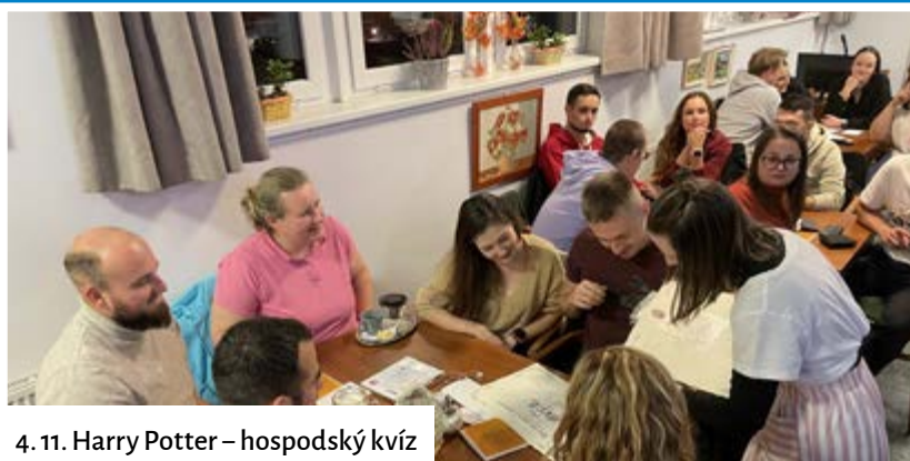
4. 11. Harry Potter – hospodský kvíz