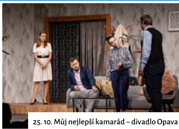
25. 10. Můj nejlepší kamarád – divadlo Opava