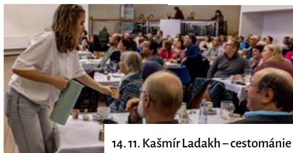
14. 11. Kašmír Ladakh – cestománie