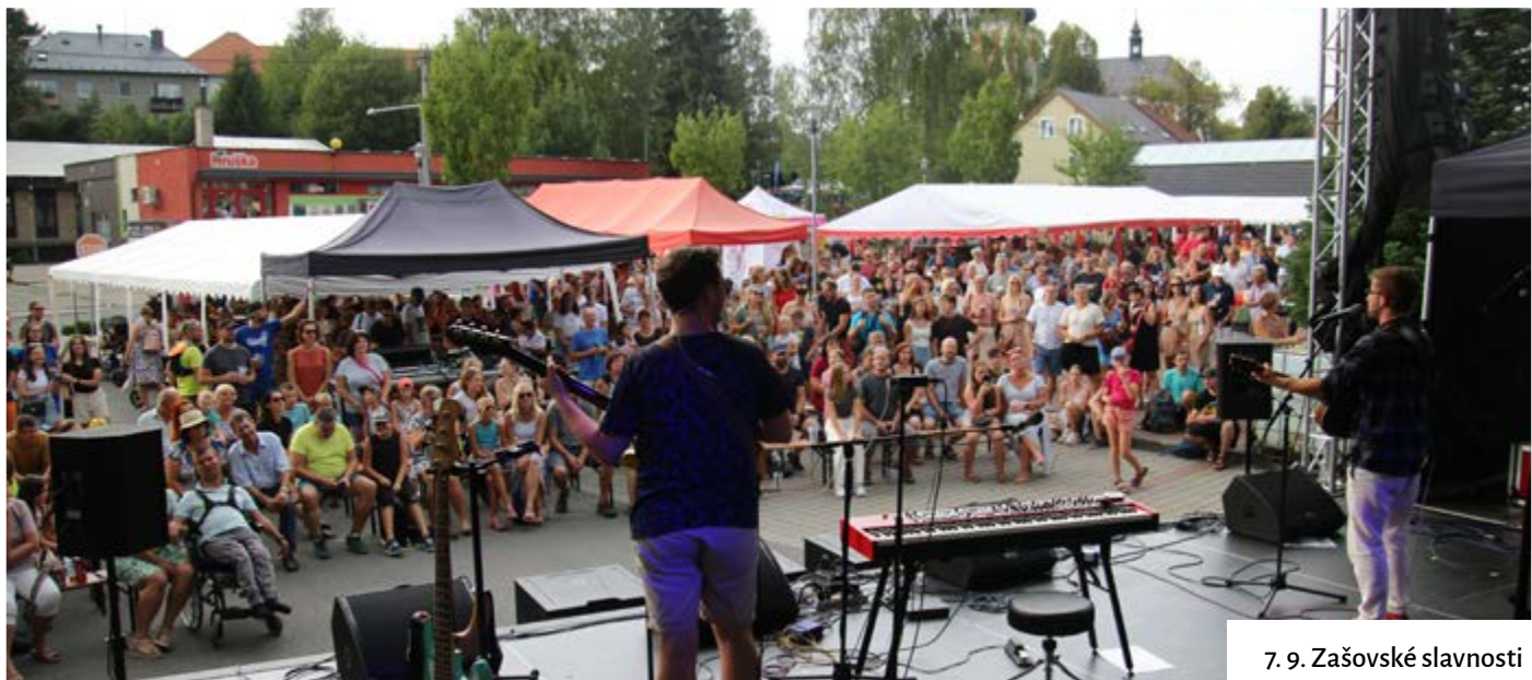
7. 9. Zašovské slavnosti