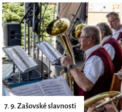
7. 9. Zašovské slavnosti