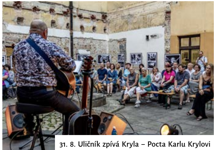
31. 8. Uličník zpívá Kryla – Pocta Karlu Krylovi