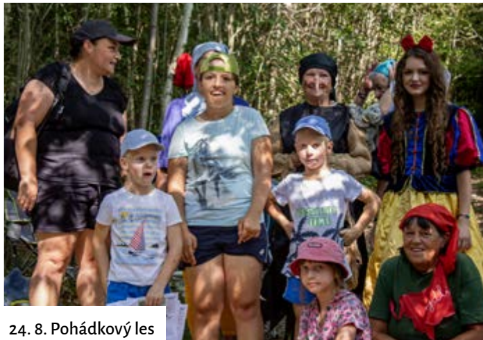
24. 8. Pohádkový les