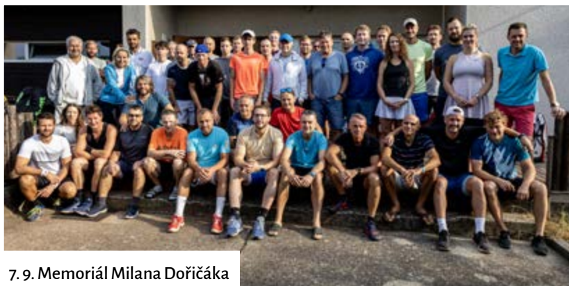
7. 9. Memoriál Milana Dořičáka