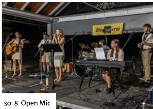
30. 8. Open Mic