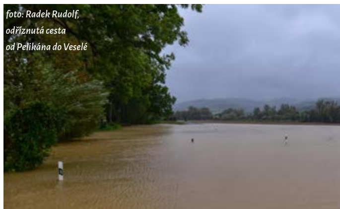
odříznutá cesta od Pelikána do Veselé

V sobotu od rána byli členové naší jednotky v hasičárně v pohotovosti, pravidelně projížděli obcí, monitorovali situaci, čistili propustky a odklízeli popadané větve z cest. K vytrvalému a stupňujícímu se dešti totiž přibýly také poryvy větru. Kolem poledne začalo přituhovat, přišly intenzivnější srážky a ty se ihned projevíly. Propustky a příkopy přestaly stíhat přívaly vody, která se z kanálů vylévala na cestu a hladina Veselského potoka šla ihned nahoru. V odpoledních hodinách došlo k zaplavení příjezdové cesty do Veselé „U Pelikána“. Jediným příjezdem do Veselé tak zůstala cesta přes Luhy. Situace byla dramatická, intenzivní deště však naštěstí trochu ubraly na síle a voda se z cest vrátila do příkopů. Pršelo dále, ale již ne tak prudce. Práci nám přiděloval hlavně vítr a padající větve a stromy.