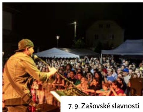
7. 9. Zašovské slavnosti