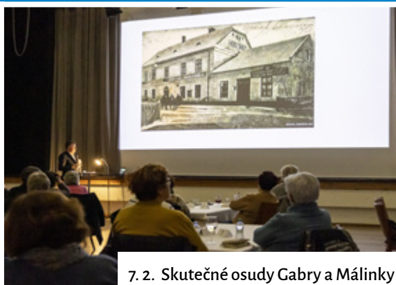
7. 2. Skutečné osudy Gabry a Málinky