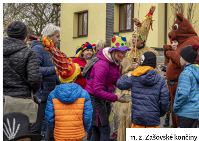
11. 2. Zašovské končiny