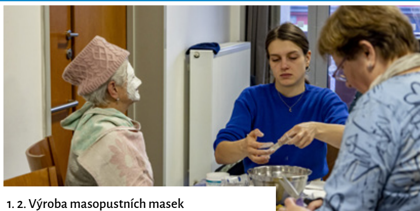
1. 2. Výroba masopustních masek