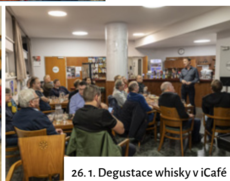
26. 1. Degustace whisky v iCafé