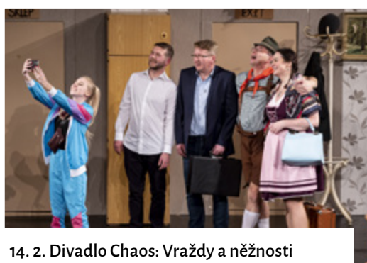
14. 2. Divadlo Chaos: Vraždy a něžnosti