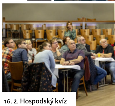
16. 2. Hospodský kvíz