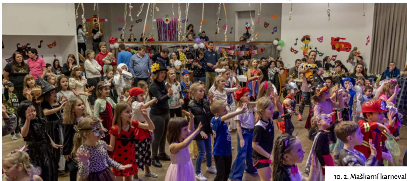
10. 2. Maškarní karneval