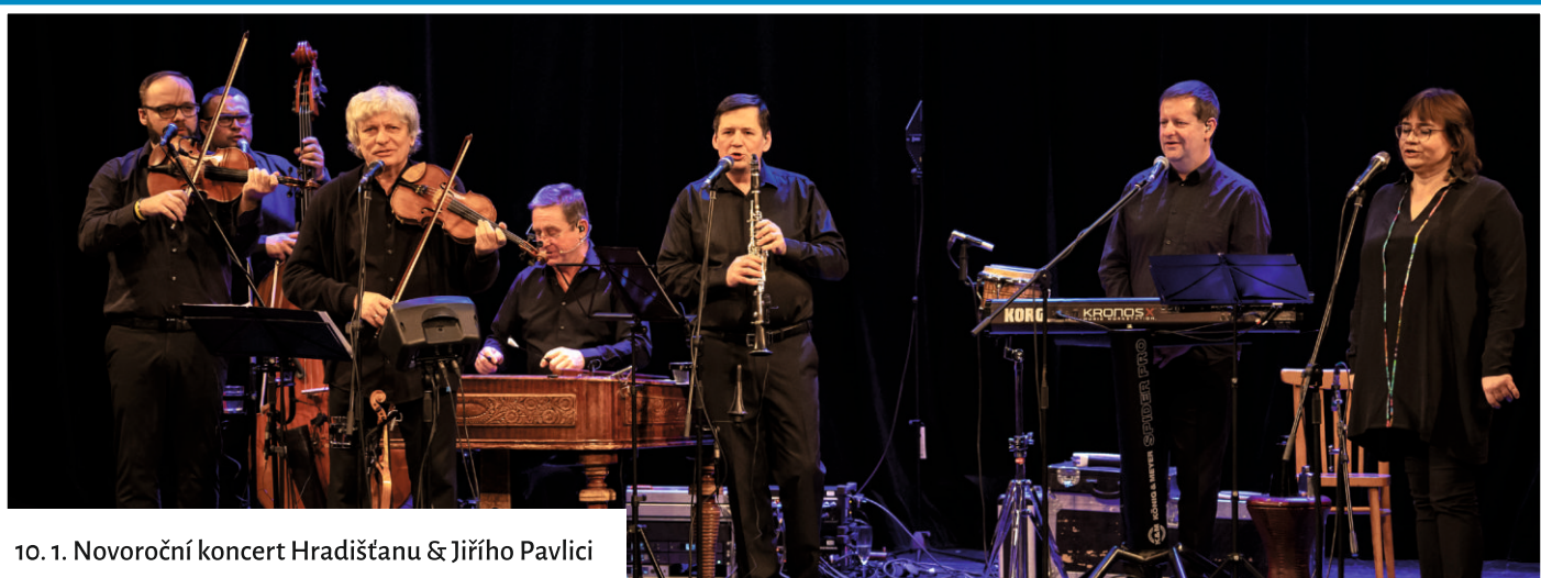
10. 1. Novoroční koncert Hradišťanu & Jiřího Pavlici