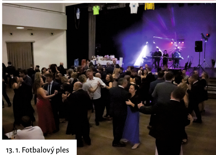
13. 1. Fotbalový ples