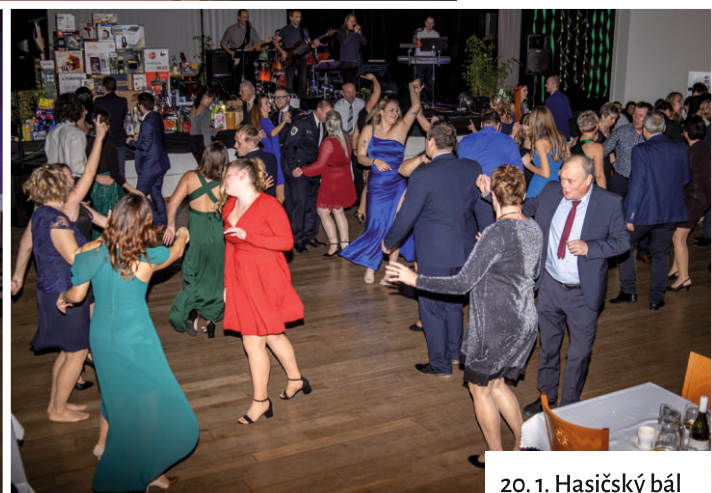
20. 1. Hasičský bál