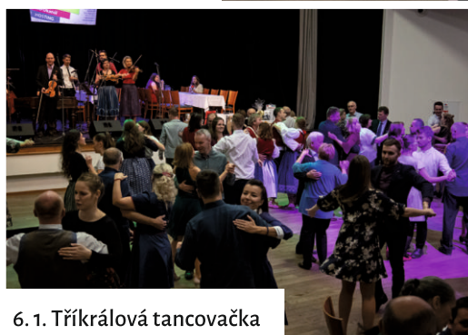
6. 1. Tříkrálová tancovačka