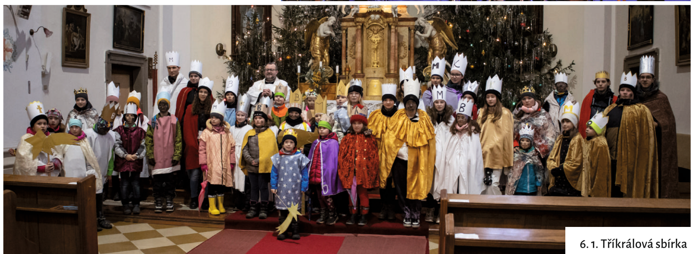
6. 1. Tříkrálová sbírka