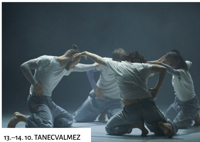
13.–14. 10. TANECVALMEZ