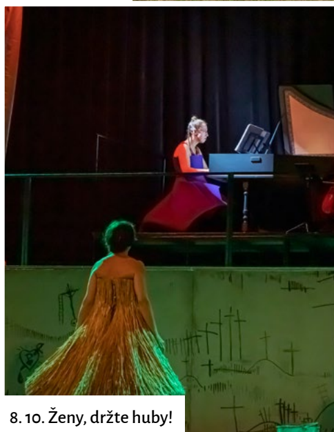
8. 10. Ženy, držte huby!