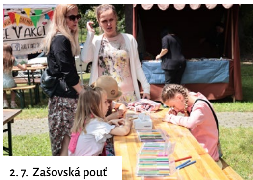
2. 7. Zašovská pouť