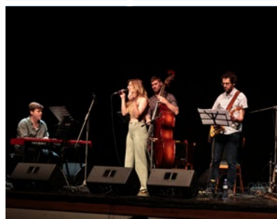
26. 6. Křest alba Petra Nohavici