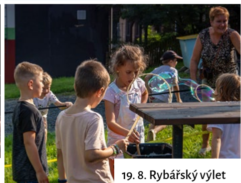
19. 8. Rybářský výlet