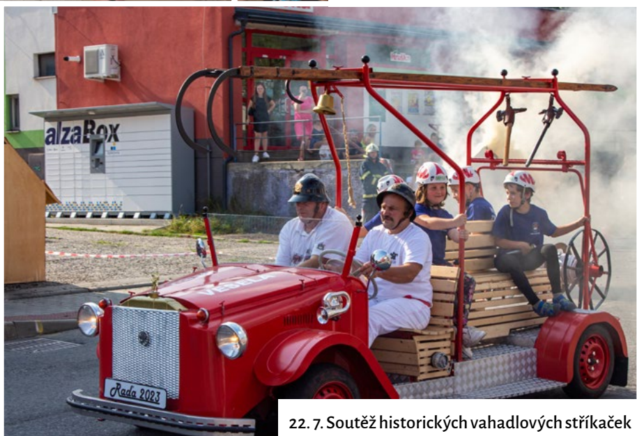
22. 7. Soutěž historických vahadlových stříkaček