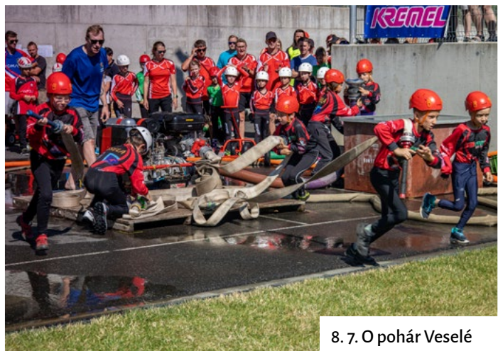
8. 7. O pohár Veselé