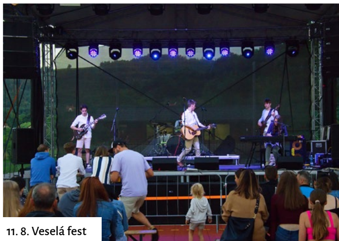
11. 8. Veselá fest