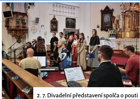
2. 7. Divadelní představení spolča o pouťi