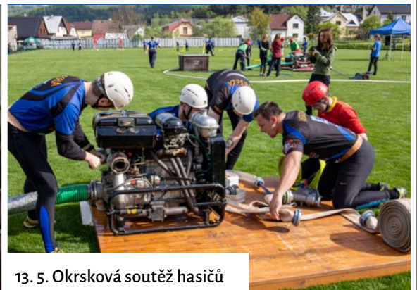
13. 5. Okrsková soutěž hasičů