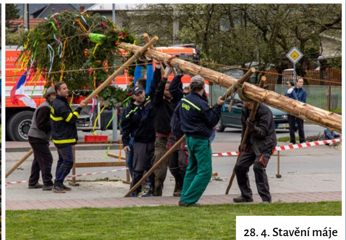
28. 4. Stavění máje