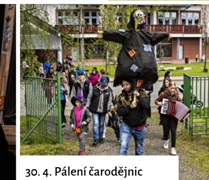
30. 4. Pálení čarodějnic