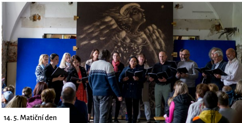
14. 5. Matiční den