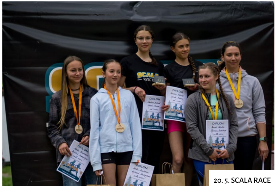
20. 5. SCALA RACE