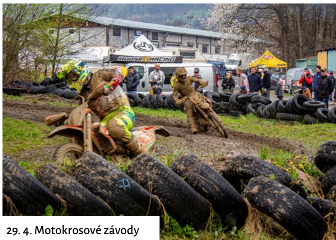
29. 4. Motokrosově závody