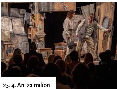
25. 4. Ani za milion