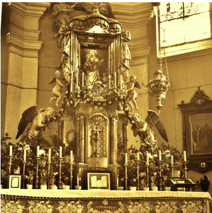
(Fotografie z doby, kdy na oltáři nebyl historický mariánský obraz, ale dílo Lad. Šichana z r. 1883. Pověšmout si také můžeme rozvodů elektřiny vedených po stěně za oltářem.)

Po stránce umělecké není na architektuře ani figurální výdobě tohoto oltáře nic mimořádného, samozřejmě s výjimkou samotného obrazu Panny Marie Zašovské. Co však jistě muselo před dvěma sty lety všechny zašovské farníky i poutníky zaujmout a nadchnout, to je technické řešení svatostánku. Dnes bychom to nazvali „vychytávkou“. Svatostánek je totiž dvoudílný a jeho horní část, určená k uchovávaní i k vystavování monstrance, je otočná. Svatostánek se tedy neotvírá primitivně dvířky, jak je tomu ve většině jiných kostelů, ale pootočením vnitřního tubusu svatostánku kolem svislé osy, což bylo tehdy jistě řešení novátorské a efektní na pohled.