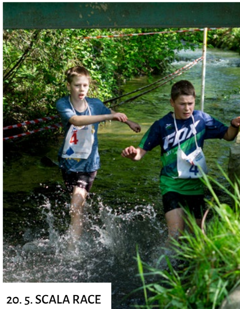
20. 5. SCALA RACE