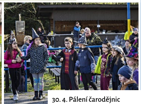
30. 4. Pálení čarodějnic