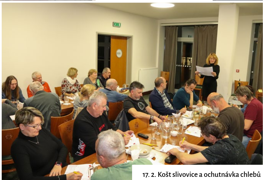
17. 2. Košť slivovice a ochutnávka chlebů