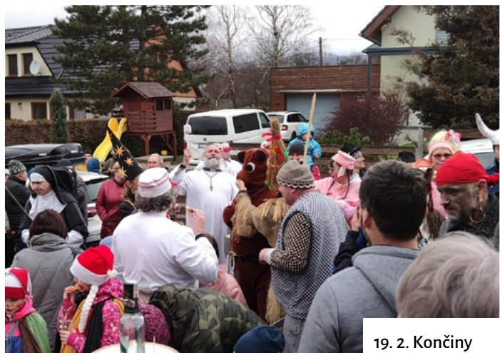
19. 2. Končiny