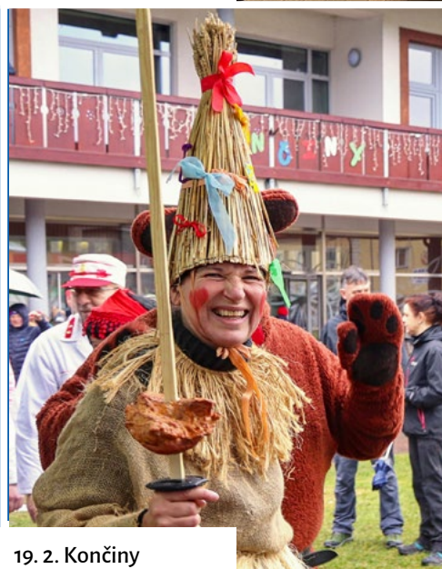
19. 2. Končiny