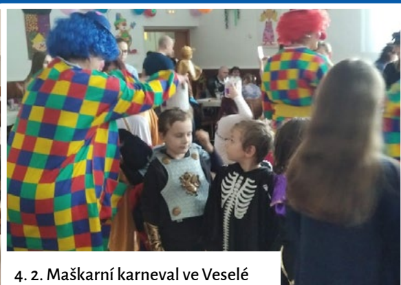
4. 2. Maškarní karneval ve Veselé