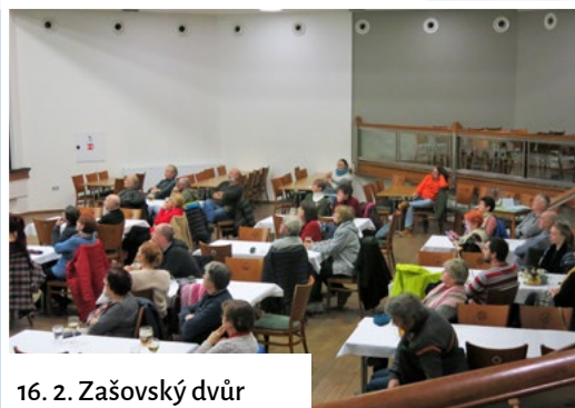
16. 2. Zašovský dvůr