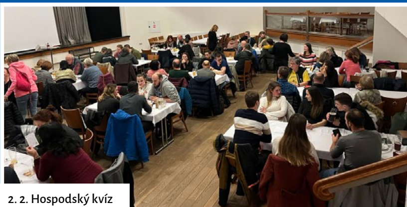
2. 2. Hospodský kvíz