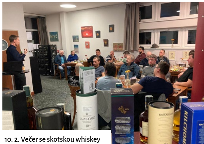
10. 2. Večer se skotskou whiskey