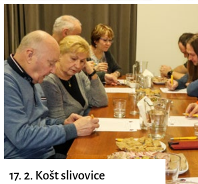
17. 2. Košť slivovice