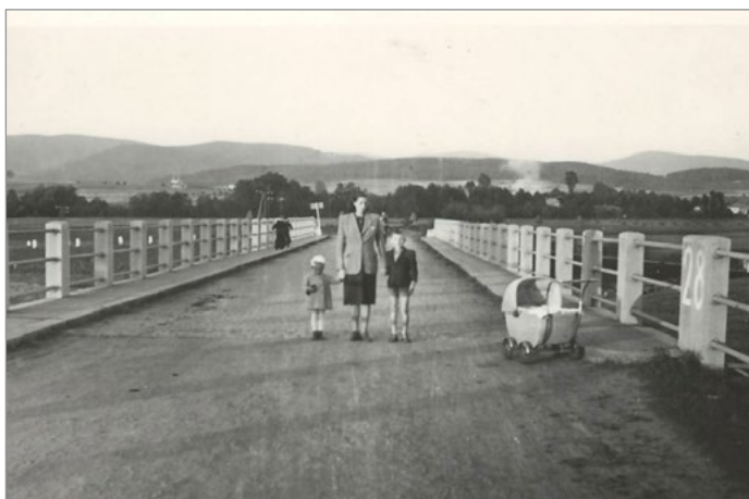
Poznámka redakce: Stávající zděný most byl vystavěn v letech 1946–1947. Do té doby se do Veselé dalo dostat pouze po dřevěné lávce.