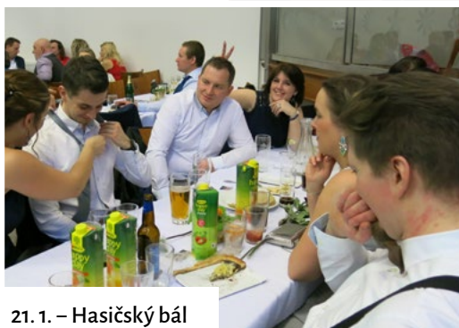
21. 1. – Hasičský bál