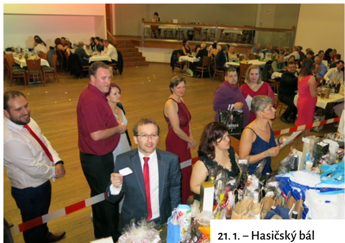
21. 1. – Hasičský bál