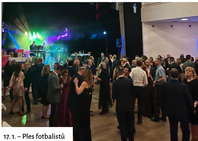
17. 1. – Ples fotbalistů