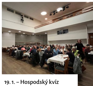
19. 1. – Hospodský kvíz