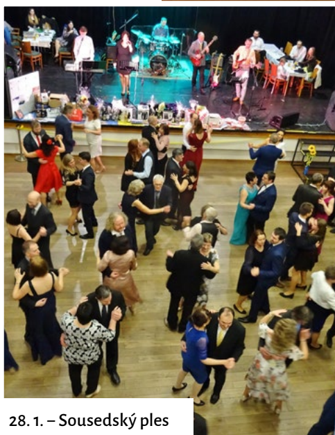
28. 1. – Sousedský ples