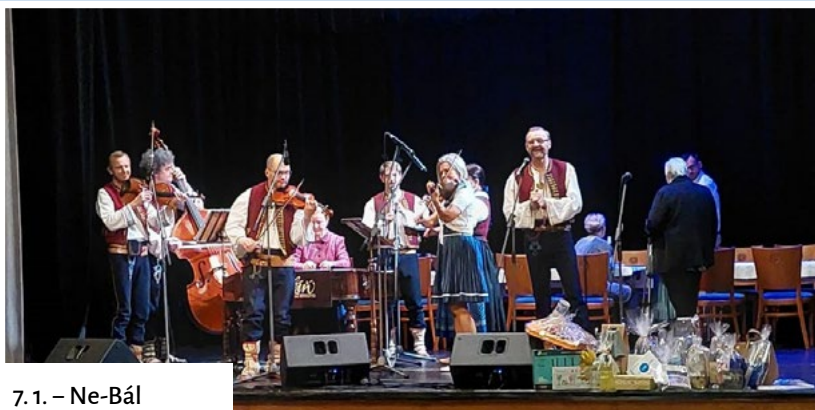
7. 1. – Ne-Bál