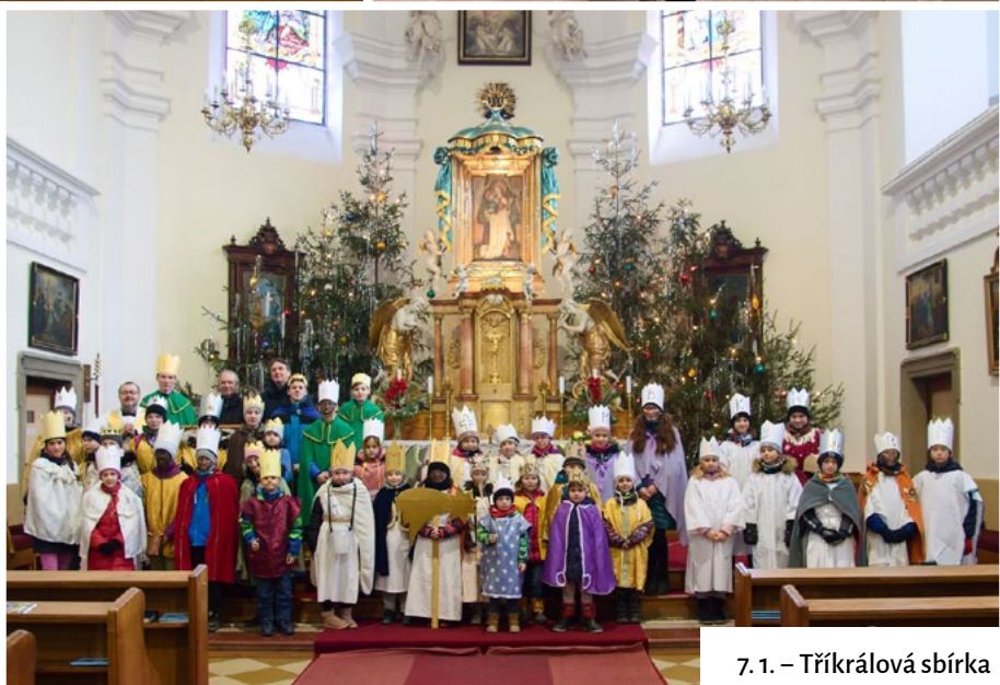
7. 1. – Tříkrálová sbírka