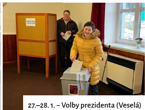
27.–28. 1. – Volby prezidenta (Veselá)

Za poskytnutí fotografií do novin i do obecního archivu děkujeme spolukřem a organizacím.