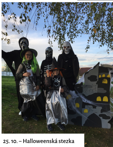
25. 10. – Halloweenská stezka