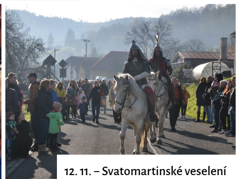
12. 11. – Svatomartinské veselení