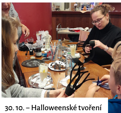
30. 10. – Halloweenské tvoření