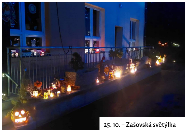
25. 10. – Zašovská světýlka