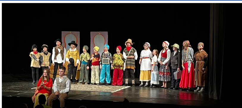
13. 11. – Lotrando a Zubejda