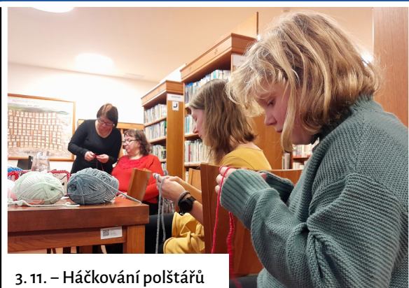
3. 11. – Háčkování polštářů