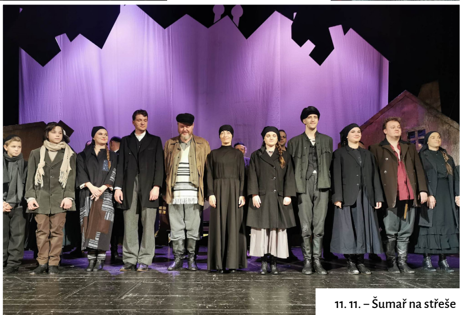
11. 11. – Šumař na střeše