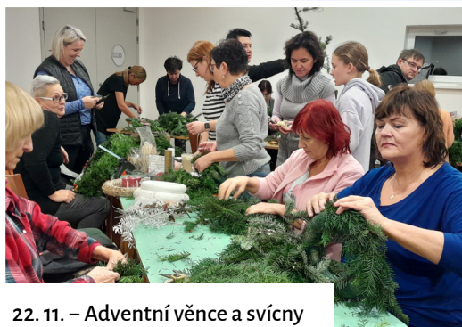
22. 11. – Adventní věnce a svíčky