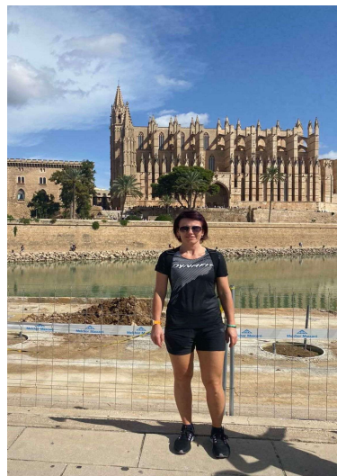
Foto z běhu 21.5 km, Mallorca, Španělsko