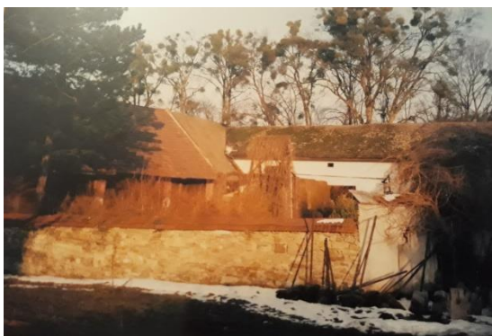
Původní vzhled fojství před rekonstrukcí

Po pěti letech se podařilo novým majitelům opravit a uvést v život původní hospodářské stavení – jeden z nejstarších domů ve Veselé, v minulosti sloužící jako dům fojta - nejváženější osoby v obci. Bývalá zemědělská usedlost slouží nyní jako „Penzion na fojství“. Celý krásně rekonstruovaný areál je nyní využíván k pronájmu (celková kapacita při plném obsazení je 18 osob), ale také pro pořádání zajímavých kulturních akcí ve Veselé.