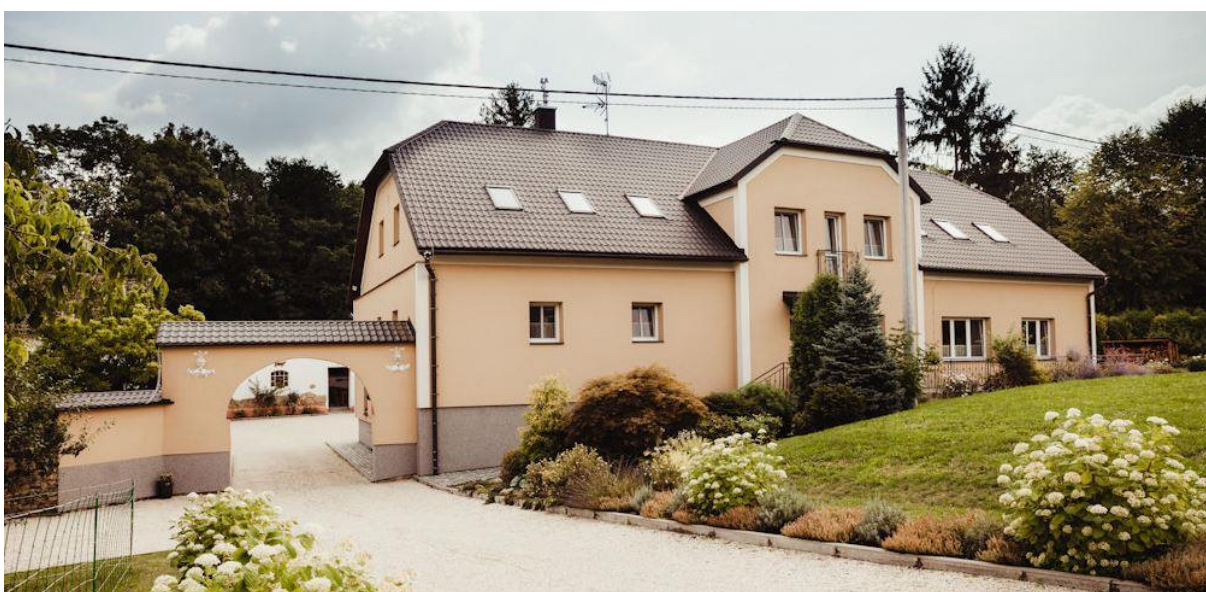
Fojství po rekonstrukci

Stará budova stodoly byla svým majitelem zbourána a přestavěna na sídlo firmy EUROnet group s.r.o. Zašová.